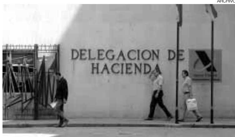
Sede principal de Hacienda en Zaragoza.

Los supuestos a partir de los cuales el Reaf ha llegado a esta