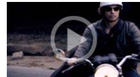
Carlos Baute se casa