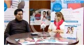
Mujer trasplantada de riñón evita la diálisis