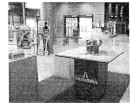
► Piezas de la muestra.

► EL CENTRO de Ocio y Comercio Aragonia acoge durante todo el mes de julio la primera muestra de Escultura de la Escuela de Artes de Zaragoza. Un total de 37 obras de madera, alabastro, arenisca, escayola o hierro, entre otros materiales, componen una muestra que alberga arte figurativo y abstracto pasando también por el expresionismo. E. P.