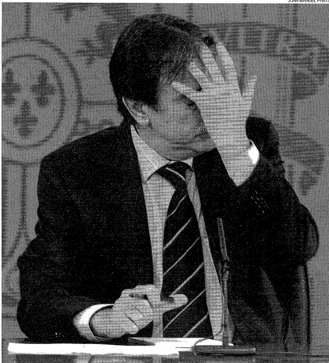
El ministro Valeriano Gómez, durante la comparecencia de ayer tras el Consejo de Ministros.

REINSERCIÓN LABORAL // El titular de Trabajo recaló que, a diferencia del anterior programa, para tener acceso a los 400 euros el desempleado deberá participar en una actividad de formación. Los parados que, aun habiendo agotado la protección por desempleo, no reúnan los requisitos para cobrar los 400 euros, podrán