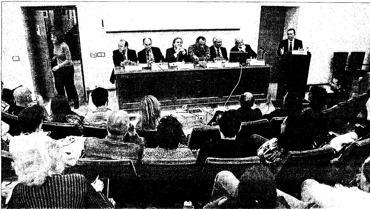
► La Facultad de Económicas organizó ayer una mesa redonda sobre la crisis económica y financiera.