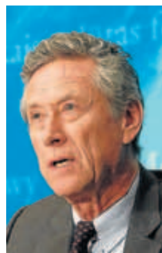
Olivier Blanchard.