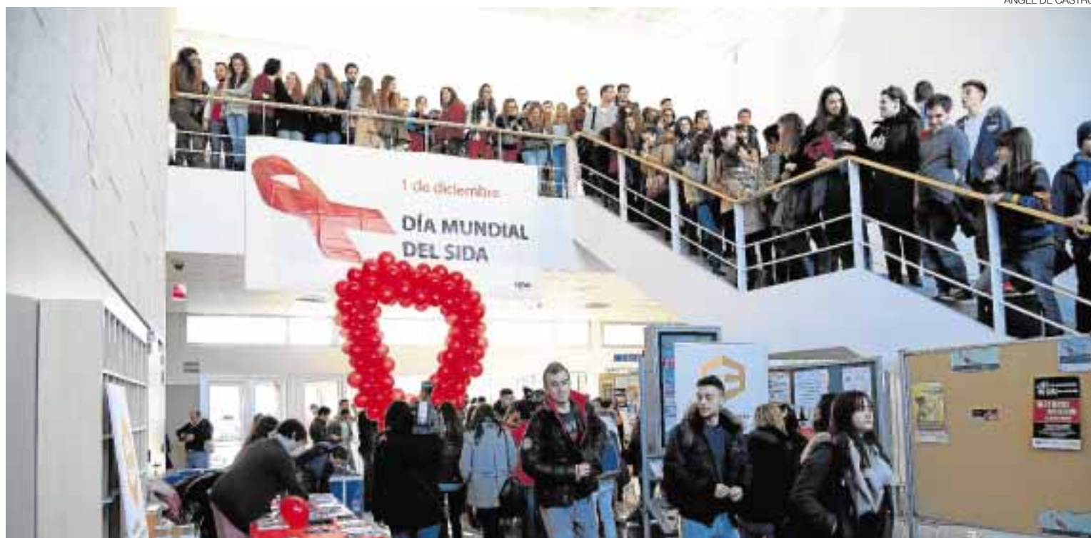
La Facultad de Economía y Empresa lució ayer un gran lazo hecho con globos rojos con motivo del Día Internacional contra el sida. Páginas 15 y 35