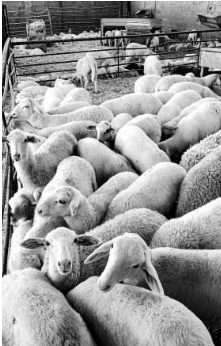
► La cabaña ovina en Aragón desciende año tras año.

BUROCRACIA MÁS FÁCIL // El plan propuesto por la organización agraria contempla facilitar la burocracia por parte de la administración para que sea más fácil mantener las granjas y los jóvenes puedan incorporarse al sector, ya que se les pide como requisitos un número excesivo de cabezas, en opinión de UAGA. Asimismo, las medidas incluyen una línea específica en el Plan de Desarrollo Rural (PDR) para la rehabilitación del sector en zonas de montaña y medidas para eliminar el fraude y promocionar el consumo. «No pedimos más ayudas económicas. Es hora de hacer una campaña de sensibilización y de analizar si Aragón sería el mismo sin ganadería ex-