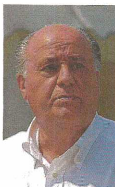
Amancio Ortega. EFE

♦ Amancio Ortega. El fundador de Inditex ha recuperado su puesto como el hombre más rico del mundo en la lista 'Forbes' por la subida de las acciones del grupo textil, que ha hecho que supere al estadounidense Bill Gates, y alcance una fortuna de 78.600 millones de dólares (69.860 millones de euros), frente a los 78.500 millones de dólares (69.776 millones de euros) del cofundador de Microsoft.