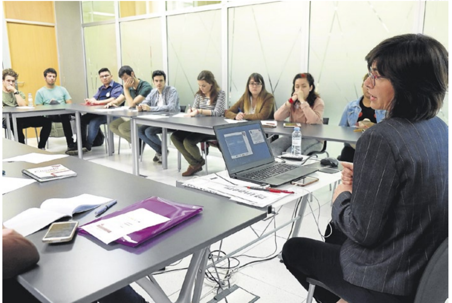
►► Varios jóvenes asisten a un taller durante la celebración de una feria de empleo en Zaragoza.

El descenso del desempleo también se ha reflejado en los perceptores de prestaciones por paro en Aragón. En estos momentos, casi 34.000 personas cobran el desempleo, aunque hay otras 30.000 que ya no lo perciben. ≡